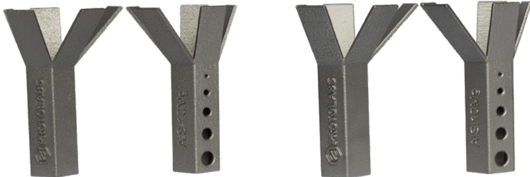
Alta resolución 30 µm