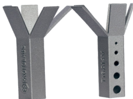
Alta resolución 30 µm