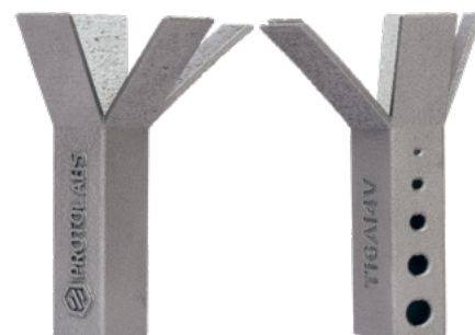
Resolución normal 60 µm